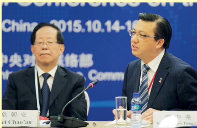
▲ 总会长在会议上发表专题演讲。