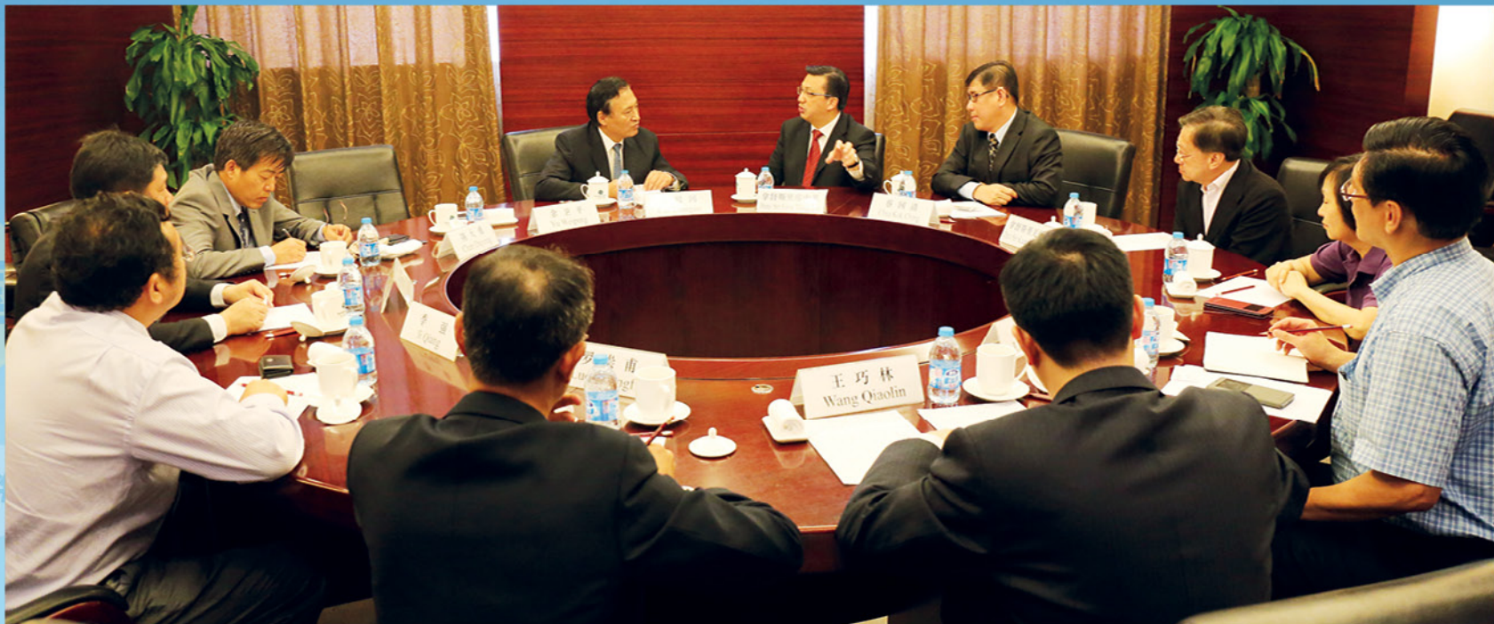
▲ 总会长与中方代表进行交流。

马来西亚是一个开放型经济国家，非常依赖国际贸易。长期以来马来西亚的贸易政策都是在寻求建立一个更加开放和公平的全球贸易环境。