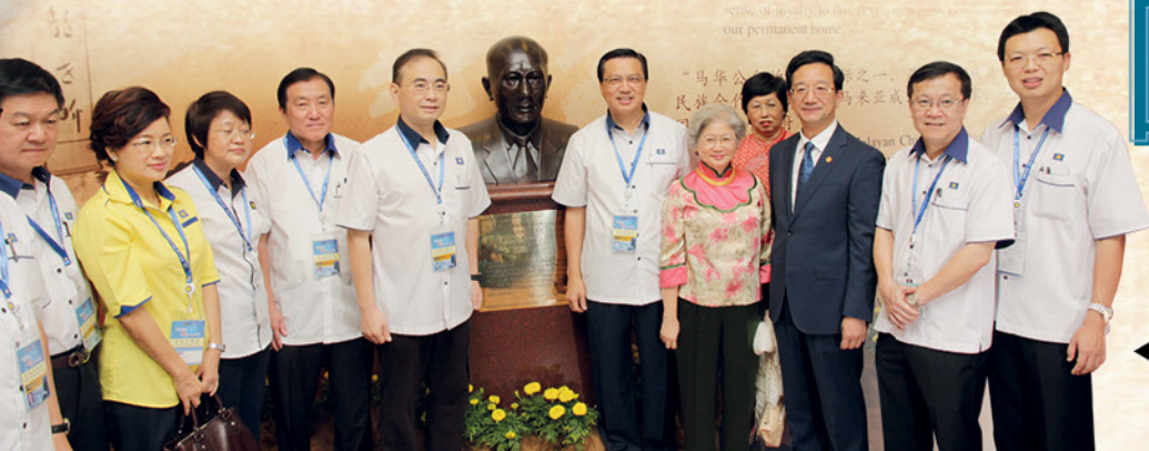
▲ 马华总会长，署理总会长连同黄惠康以及一众马华中央领袖，见证马华第一任总会长敦陈祯禄铜像揭幕礼。

2015马华三机构代表大会从2015年10月10日至11日，连续2天隆重举行。一如往常，马青和妇女组的代表大会前夕的团结宴会聚集了众多的中央领袖欢聚一堂，除了聆听领袖们的演讲，也趁机与同志碰个面。