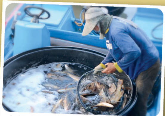
龟咯渔村养殖的各种活鱼，是老饕的桌上佳肴。

丹绒比艾拥有美味的海鲜，是吸引老饕及旅客前来的号召，单单鱼虾蟹，在厨师的煮炒煎焖高超手艺下煮出上千种美食，有垂涎的酸辣螃蟹，亚三蒸鱼或清蒸小墨鱼或虾等，逢周末假期，总是客似云来。