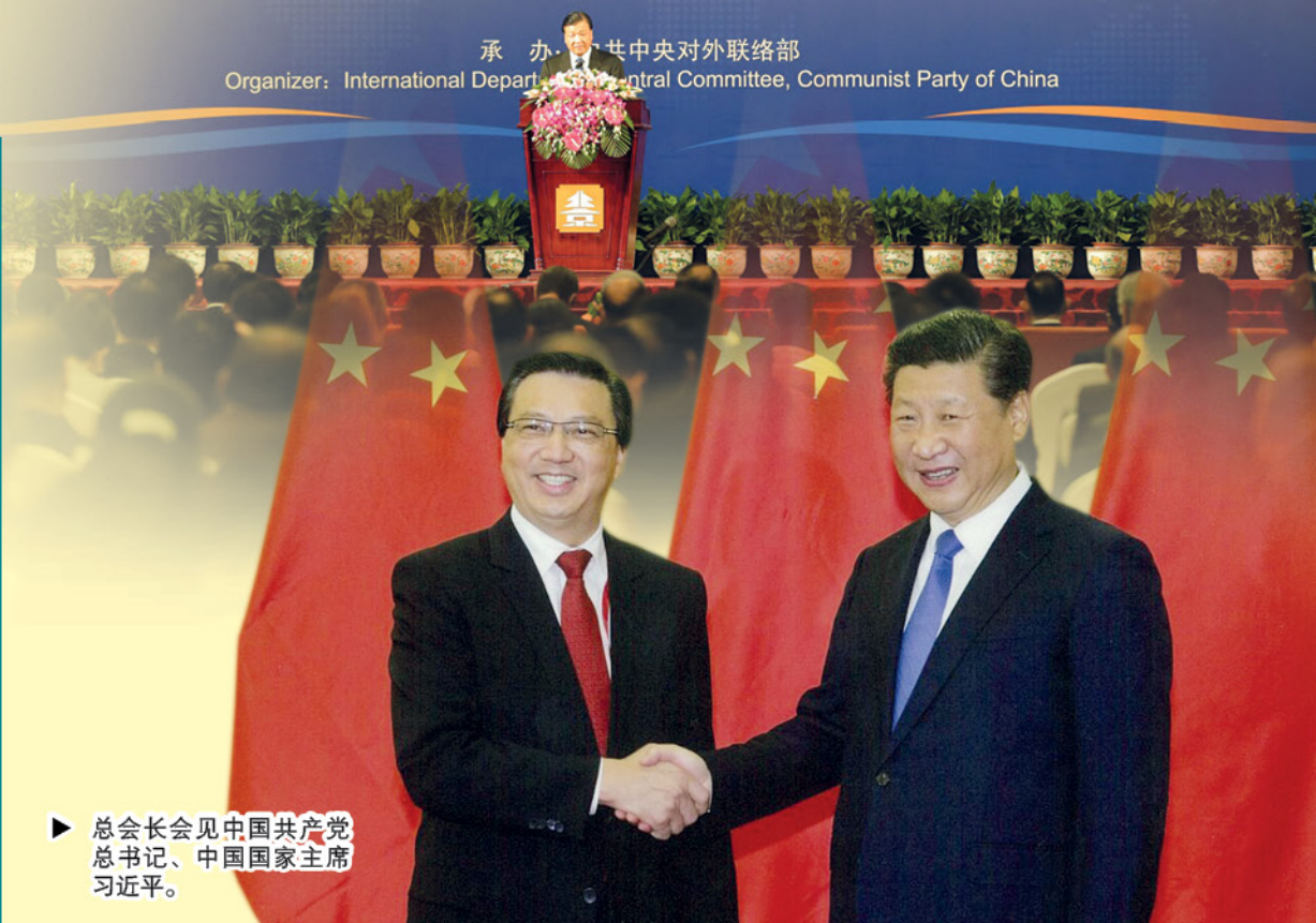
▶ 总会长会见中国共产党总书记、中国国家主席习近平。

马华总会长兼交通部长拿督斯里廖中莱今年10月14日至16日到中国北京出席亚洲政党丝绸之路专题会议。