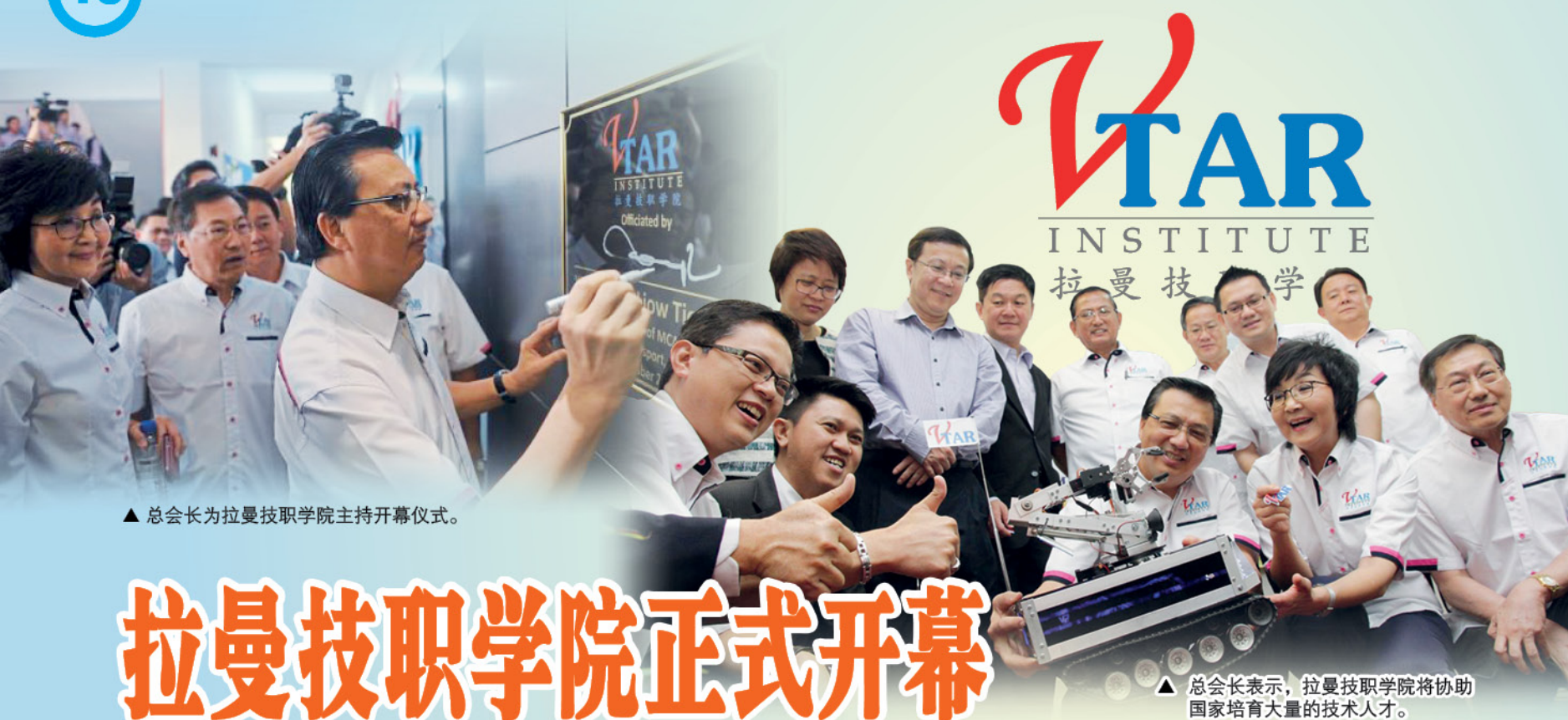
▲ 总会长为拉曼技职学院主持开幕仪式。