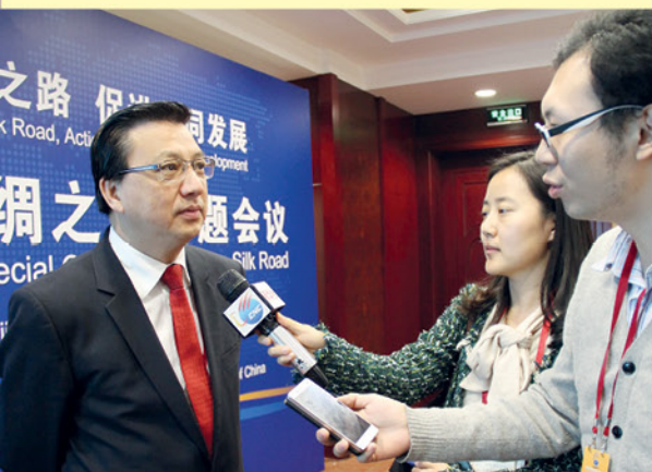
▲ 总会长接受中国媒体访问。

马华自2014年7月跟中共签署两党合作交流备忘录后，积极发展与中共的友好关系，全面提升我党与中共、马来西亚与中国之间的两党、两国双层双边关系，带领国内华商及时把握中国政府“一带一路”发展计划的先机，确保马来西亚充分掌握中国政经发展的契机。