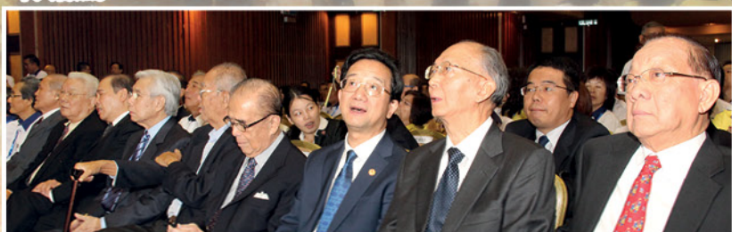
▲ 国内外领袖莅临代表大会观礼，其中包括马华前总会长陈群川，中国驻马大使黄惠康，马华前署理总会长曾永森等嘉宾。