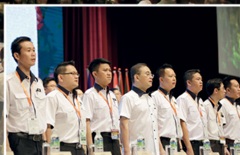
▲ 马青中央领袖全体肃立唱国歌。