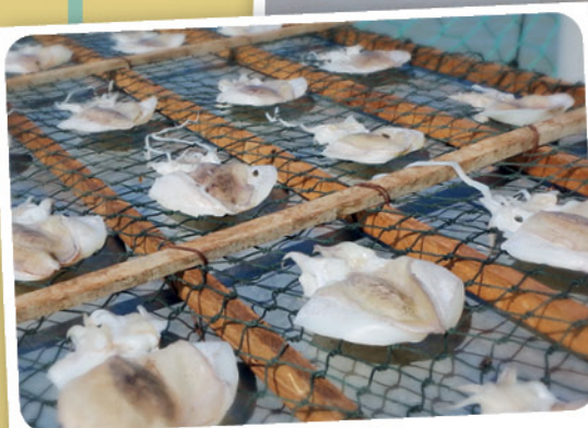
渔民把捕获的墨鱼晒干，以卖到市场。