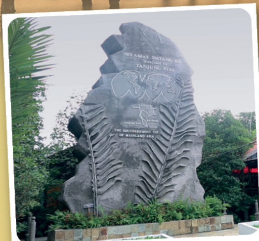
入口处的大石，是丹绒比艾国家公园的标记。

丹绒比艾是一个富有自然生态，拥有天然美景，海鲜美食、无限商机的地方。距离新山市中心90公里，以美丽的红树林，海产丰富的渔村闻名。