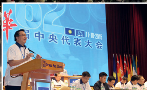
▲ 马华总会长廖中莱向同志们问好。