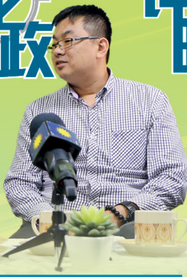
马华中央宣传局副局长， 也是评时论政主持人刘振国