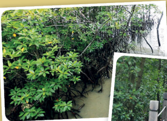
丹绒比艾国家公园，是世界上其中一个最大及保护得最好的红树林区。