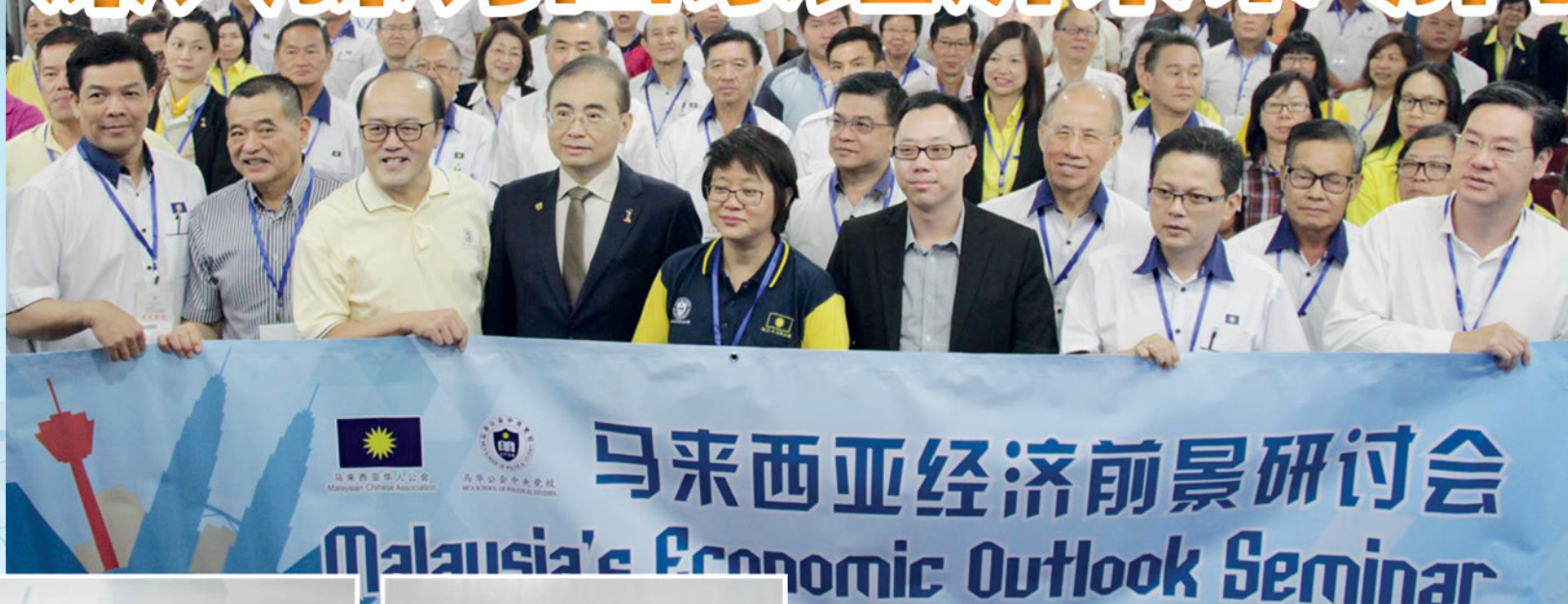
▲ 马华党校举办《马来西亚经济前景研讨会》，约有200名党员踊跃出席。