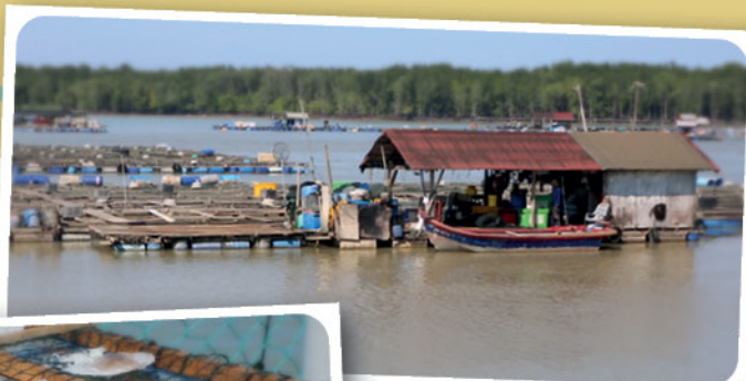
大大小小的养鱼场，每天供应海鲜予国内外的大小餐馆。