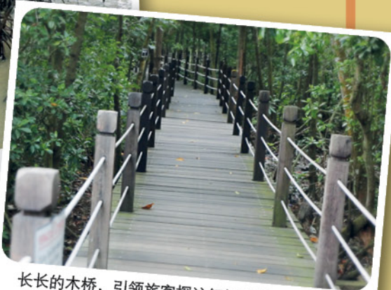
长长的木桥，引领旅客探访红树林的幽密。