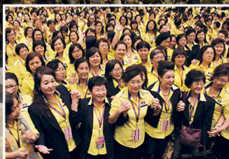
▲ 全体出席大会的妇女组同志们，大家来个大合照。