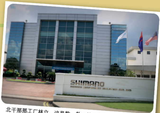
北干那那工厂林立，这是数一数二的脚车零件厂。

在与新加坡比邻，以及比新山的生活水平低的情况下，近年来北干那那的新兴工业纷纷冒起，现在的北干那那反而由生产钓鱼器具和脚车零件的日本工厂等带动经济，也制造了成千上万的就业机会。