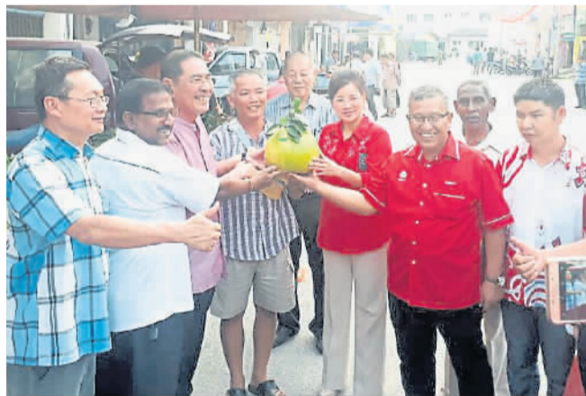
协助农耕业者与养殖业者申请地契，提高生产率。