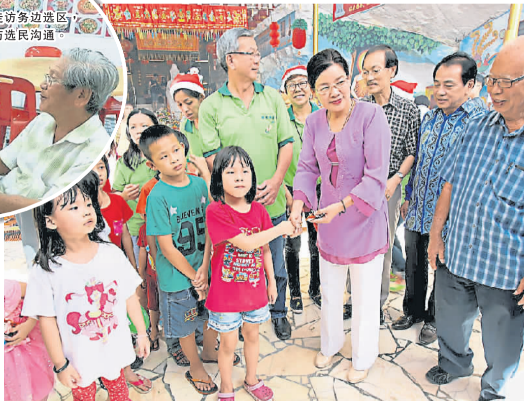
跨越宗教与文化藩篱，在观音洞欢庆冬至与圣诞节。