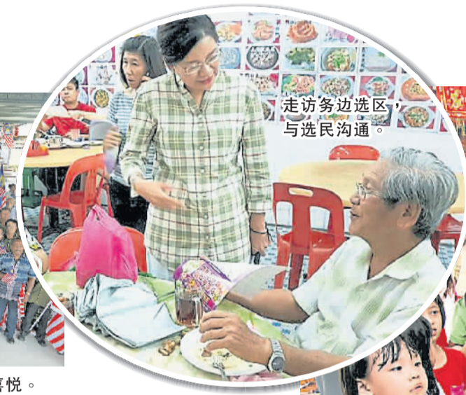
走访务边选区，与选民沟通。

我希望她能中选，就能继续为务边选民发声，改善务边包括安邦社区居住环境，提升社区路灯以减免罪案，以及解决一切民生问题。