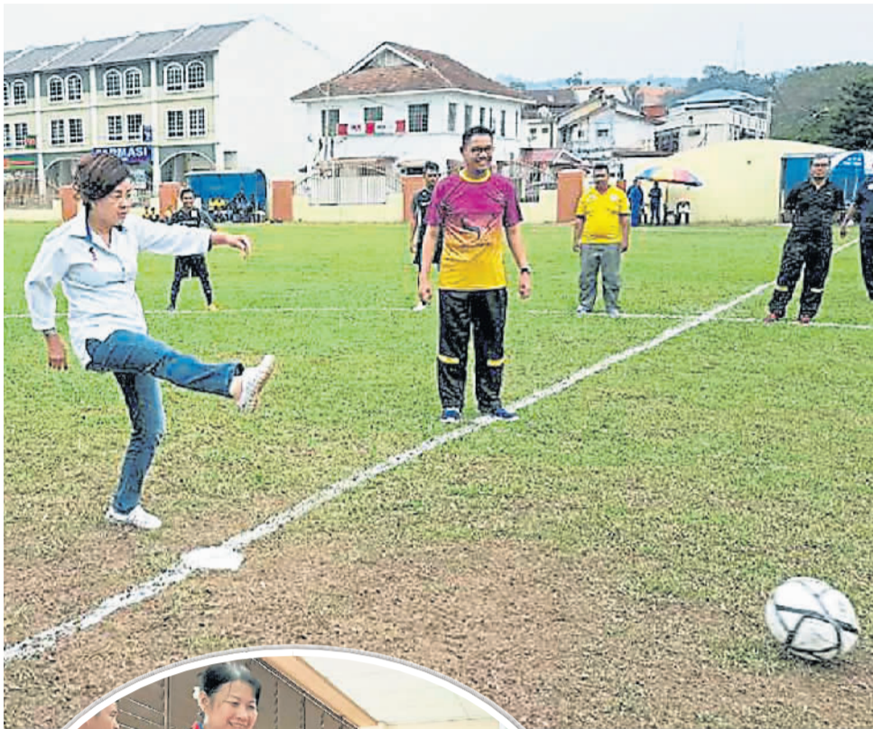
与民同乐，参与足球活动。