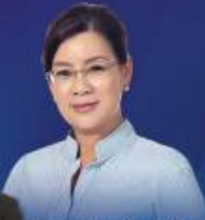
Datuk Heng Seal Kie P071 Parlimen Gopeng