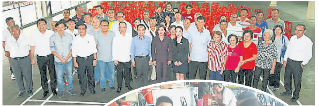
邀请中国西安新丝路国际交流促进会到务边宣讲，缔造外贸及投资商机。