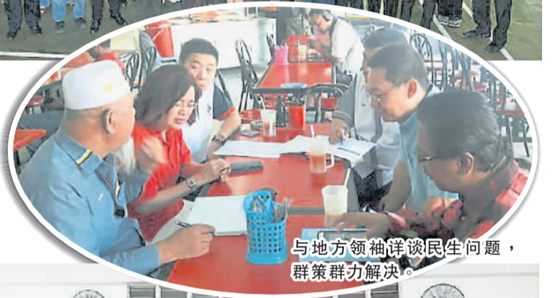
与地方领袖详谈民生问题，群策群力解决。