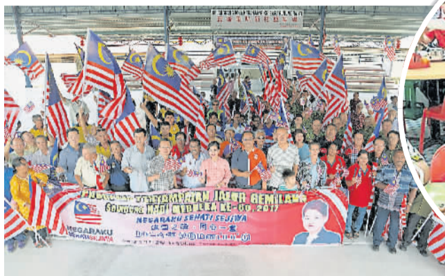
欢庆独立日 60 周年，与务边选民挥动国旗分享喜悦。