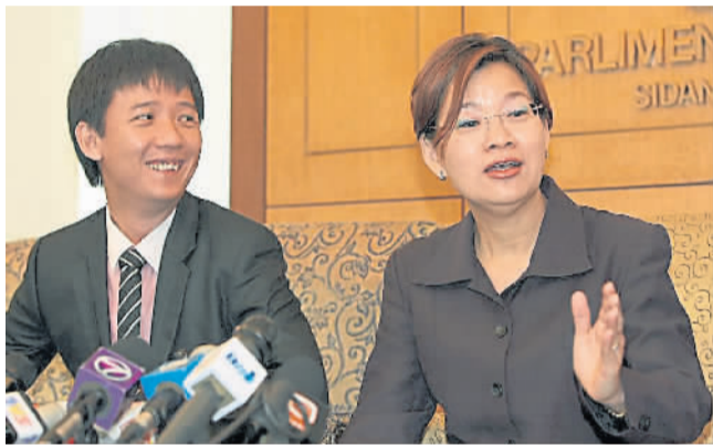
阿牛电影《初恋红豆冰》获得退税！

重新诠释本土电影，废除其至少 70% 马来语对话的要求，使其他语言的电影（包括中文）与马来语电影享有同等的奖励津贴及豁免 20% 娱乐税，成功扭转大马电影的前景，促进大马中文电影的蓬勃发展。