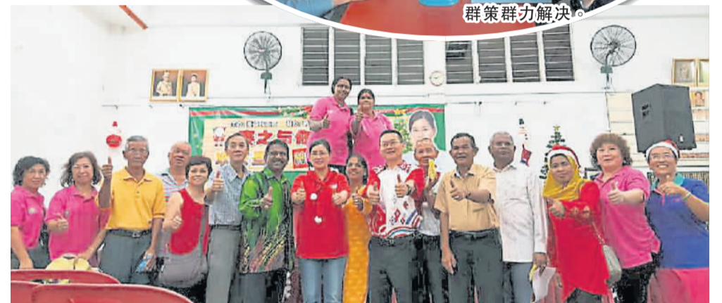
跨越种族宗教，与务边全民欢庆圣诞节。