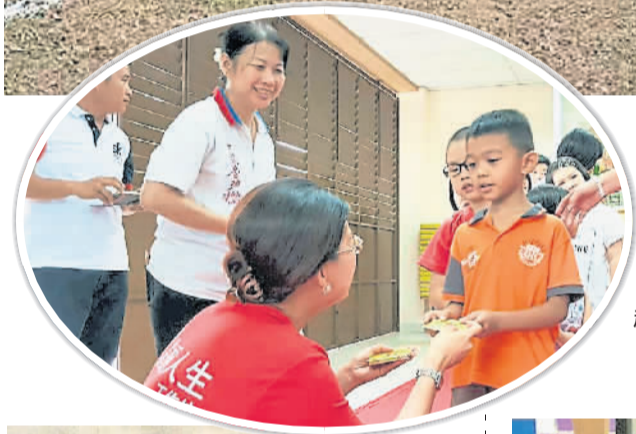
趁着新年给孤儿献上关怀。