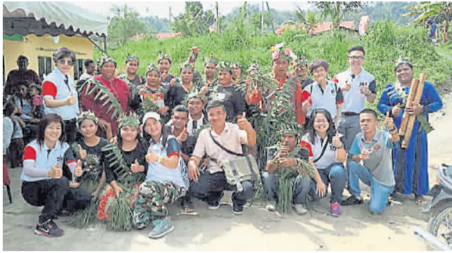
王赛之团队走入原住民村落服务。