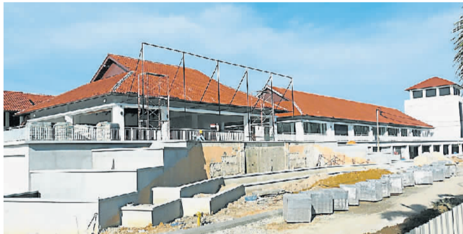
务边的银州艺术工作坊打造旅游文化及制造生产事业，为勤劳工作者造就工作机会。