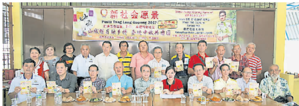
联合务边华团推广中华文化活动。