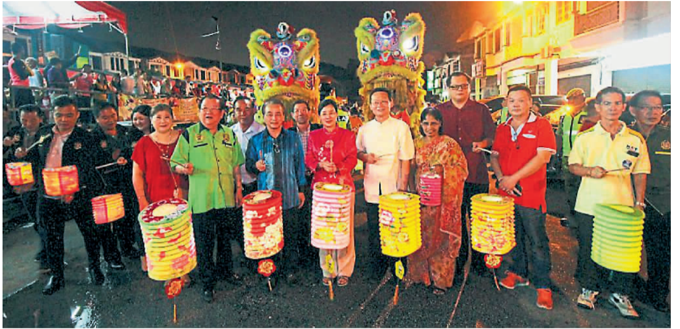
与霹靂中华大会堂配合推动中华文化遗产。